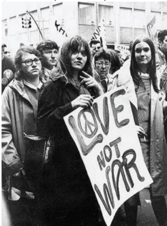
Texto do Cartaz: "Amor e não guerra"

Foto de Jovens em protesto contra a Guerra do Vietnã.